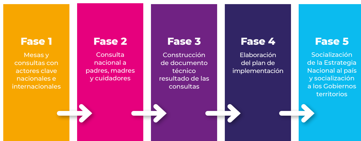
Figura 1. Fases de elaboración de la Estrategia Nacional Pedagógica y de prevención del castigo físico, tratos crueles, humillantes o degradantes