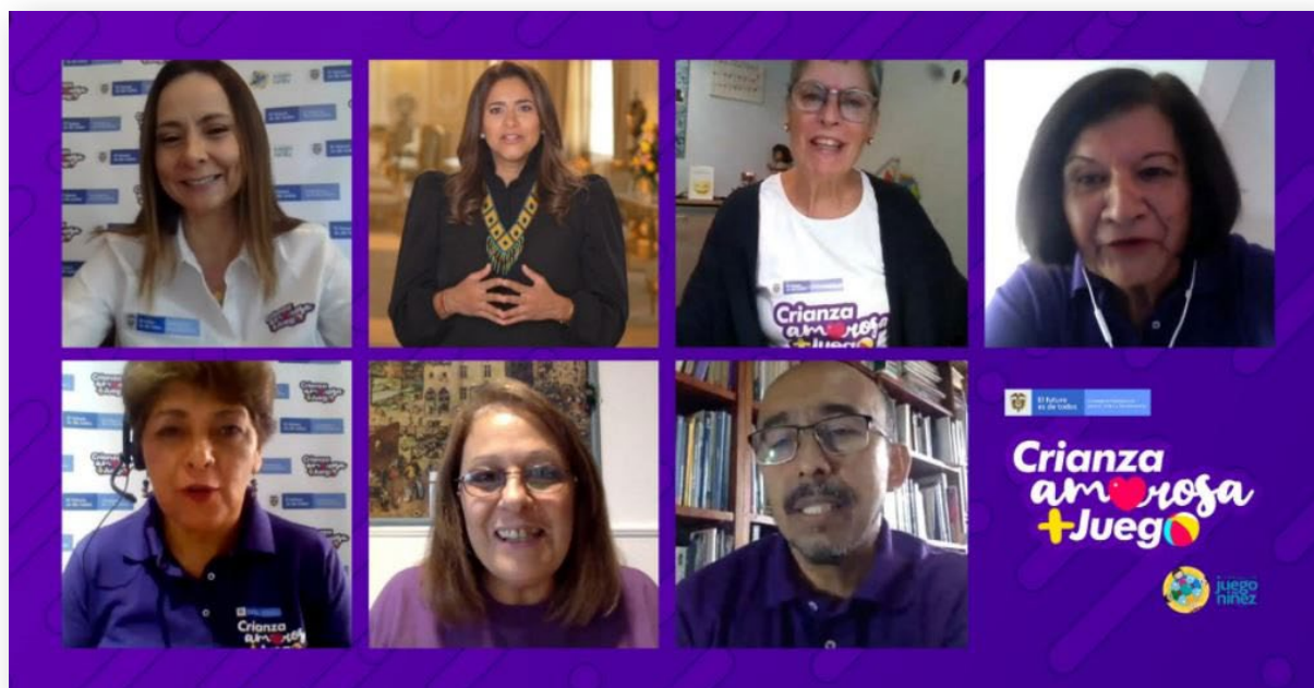
Ponentes nacionales e internacionales Foro Crianza Amorosa + Juego . 2020