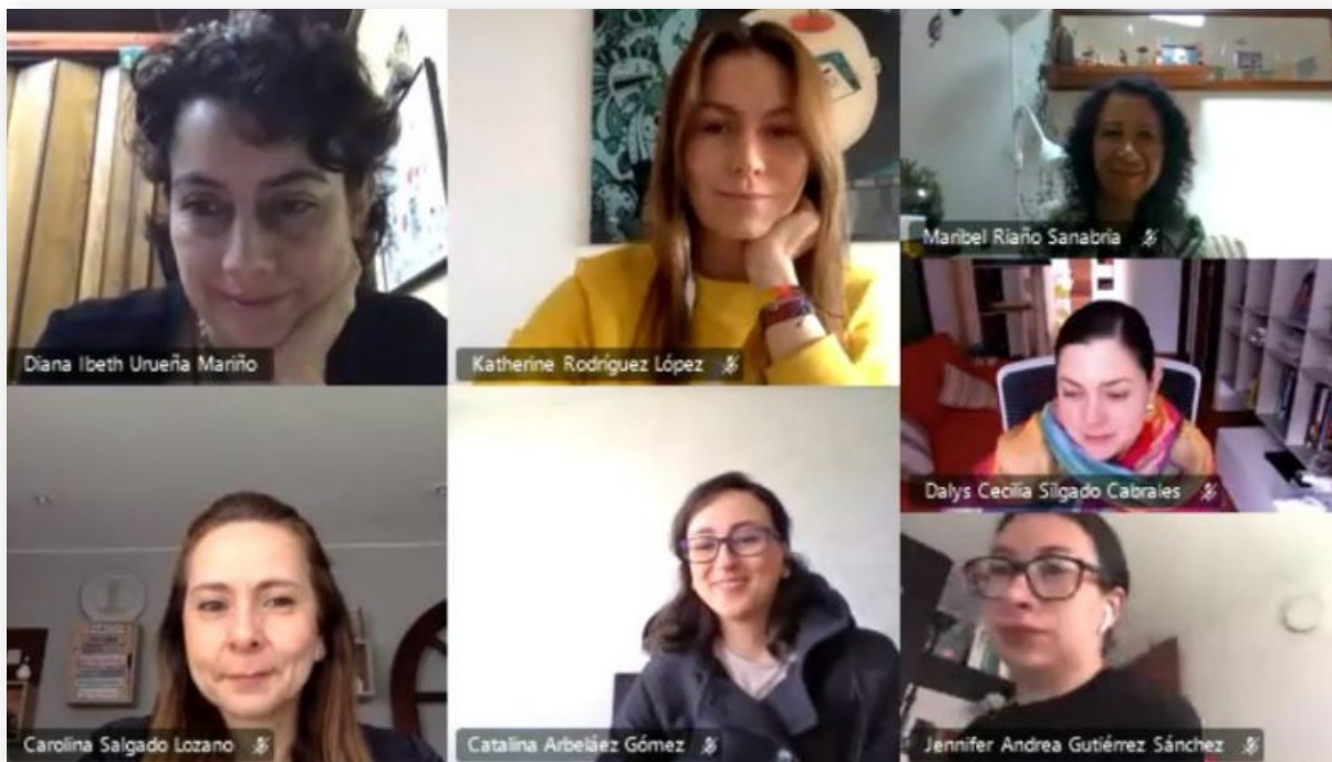
Participantes Laboratorio Pedagógico Crianza Amorosa + Juego. 2020