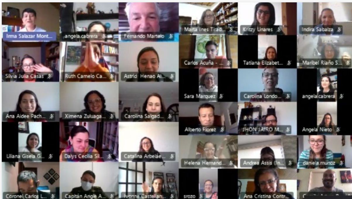
Participantes Laboratorio Pedagógico Crianza Amorosa + Juego, 2020